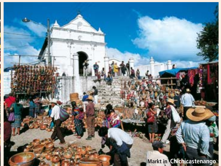
Markt in Chichicastenango

erforschten Maya-Stätten überhaupt. Quirigua bietet überaus kunstvolle und aufwendige Bildhauereien der Maya-Kultur und Monolithen von unbeschreiblicher Formenvielfalt. Nachmittags Weiterfahrt nach Puerto Barrios. 1 Nacht im Hotel Green Bay. Ca. 200 km (F)