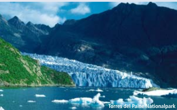
Torres del Paine Nationalpark