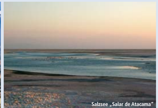
Salzsee „Salar de Atacama“

dieser Gegend. Am Abend Rückfahrt nach Puerto Varas. Ca. 250 km (F)