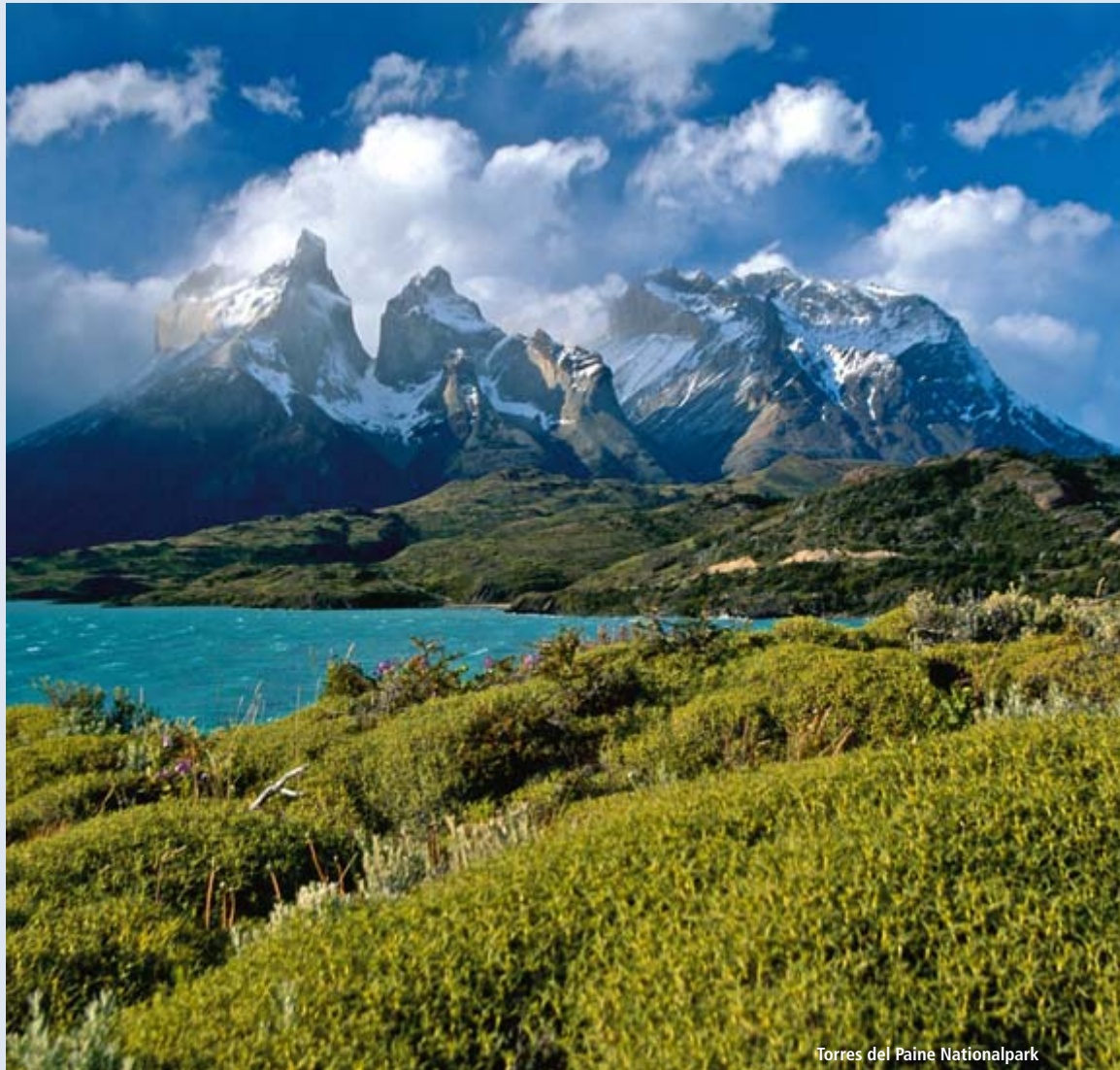
Torres del Paine Nationalpark

Auf klassischer Route durch Chile – beliebt und bewährt bei Einsteigern und Kennern. Diese Rundreise führt Sie zu den Höhepunkten Chiles. Besucht werden unter anderem die Metropole Santiago de Chile, die einzigartige Atacama-Wüste, die Insel Chiloé, die Seenregion und Patagonien mit seinen riesigen Gletschern im äußersten Süden des Landes. Tauchen Sie ein in ein Land voller unvergesslicher geographischer Gegensätze.