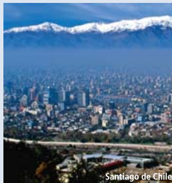
Santiago de Chile