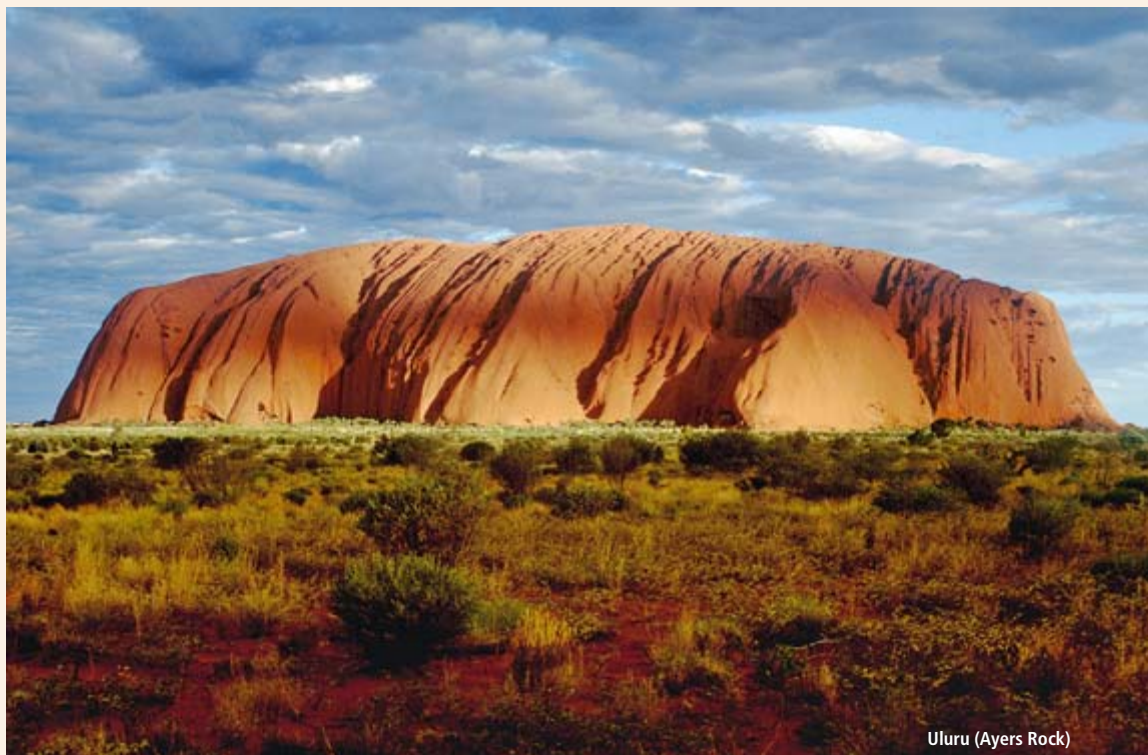
Uluru (Ayers Rock)

Bitte Mietwagen separat dazu buchen, Sonderraten und Kategorien siehe Tabelle.