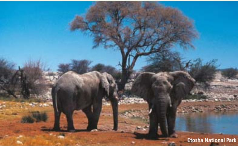
Etosha National Park